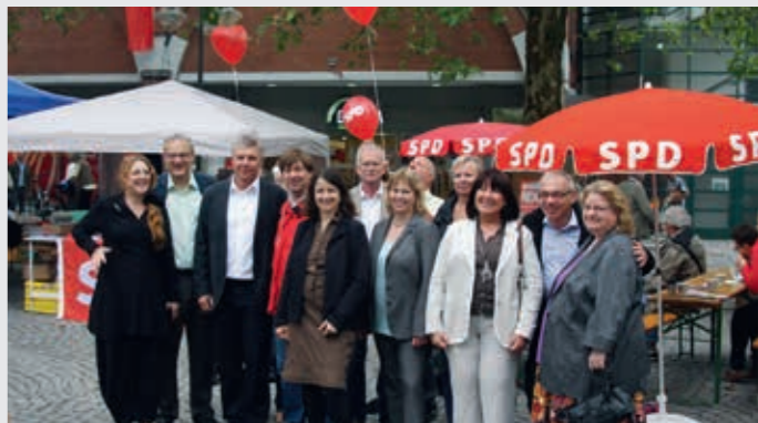
„Wir arbeiten Hand in Hand in Stadt und Land!“